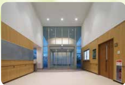
開放感ある明るいエントランス