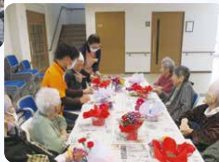
お花のアレンジメントづくり