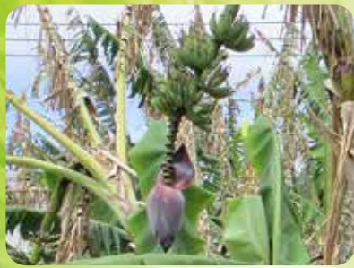
施設内にあるバナナの実と花

ご家族の方が、なによりご本人さまが「よかった」とおもっていただけるよう 一人ひとりの暮らしを大切にし、サポートする個別ケア