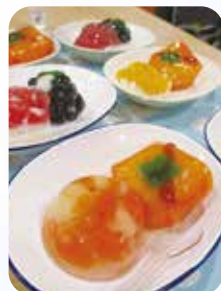
敬老会で食べたスイーツ