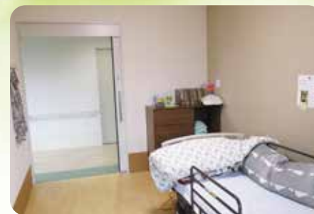
プライバシーを大切にしたい個室