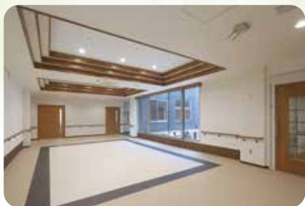
レクリエーションや笑顔が通いあう交流ホール