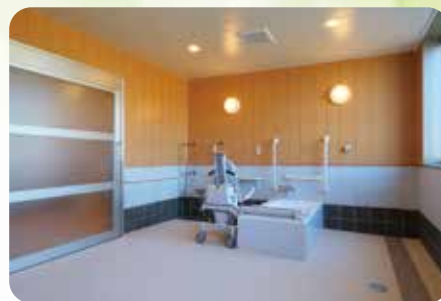
安心・安全に配慮した浴室